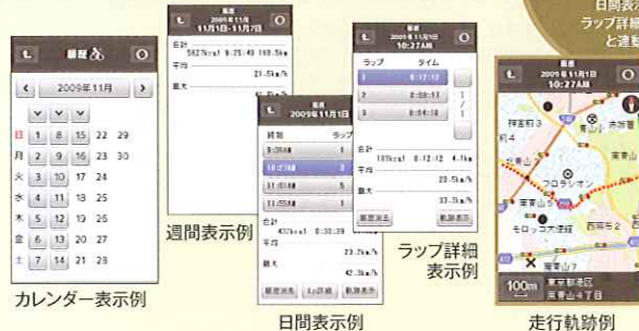
カレンダー表示例

過去の走行データをカレンダー形式で保存。確認表示も(月・週・日・ラップ)から選択できます。過去データへのアクセスが簡単! 実力アップも一目わかります!