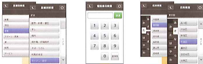
業種から 電話番号から 住所から