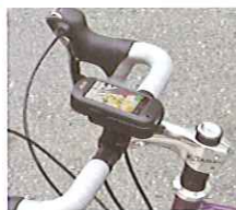
カンタンに自転車のハンドルやステムにマウントできます。

※ログの記録には、別途2GB以下のmicroSDカードまたは、8GB以下のmicroSDHCカードが必要となります。※ATLASTOUR®は弊社HPより無料で提供しております。本機には同梱されていませんのでご注意ください。